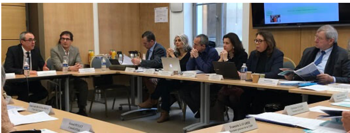
Plénière du 8 mars 2017 Toutes les décisions prises par la Commission

Lors de sa réunion du 8 mars 2017, la Commission nationale du débat public a examiné les dossiers suivants :