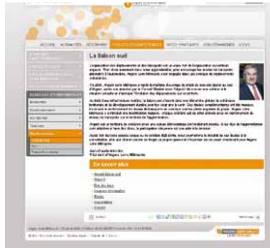
Vue de la page Liaison sud du site Internet

Cette rubrique a été ouverte le 12 décembre 2011. 7000 visiteurs et 10 000 pages consultées