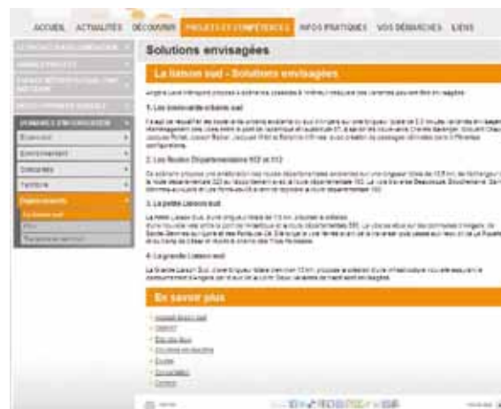
Une page de la rubrique Liaison sud du Site Internet

La page dédiée au projet a totalisé 7000 visiteurs et plus de 10 000 pages consultées.