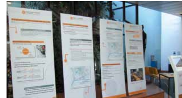
L'exposition à Angers

Une exposition itinérante présentant le projet a été mise en place du 22 février au 20 avril 2012. Elle a été annoncée par voie de presse, dans les magazines de communes et par des affiches A3. Proposée aux 33 communes de l'agglomération et aux 3 communes hors agglomération concernées par le projet, elle était couplée à des permanences assurées par un technicien d'Angers Loire Métropole (voir programme page 7).