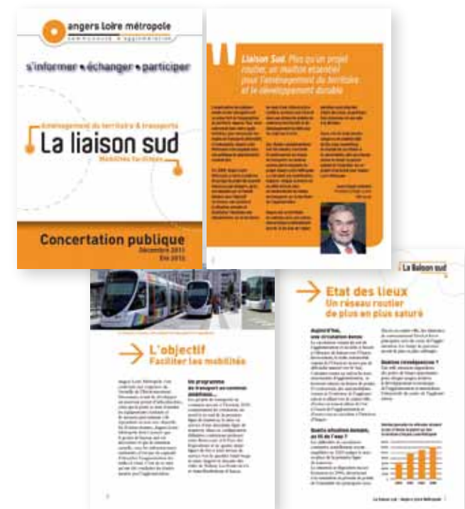
Extraits de la plaquette d'information

Un affichage dans les commerces et les lieux publics a été installé annonçant chacune des réunions publiques.