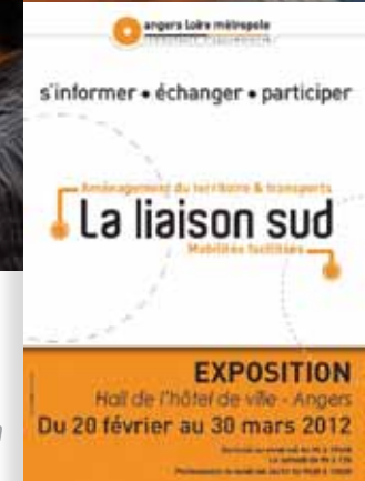
L'affiche de l'exposition