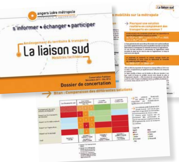
Extraits du dossier de concertation

Nombre d'exemplaires distribués : 4200 sur l'agglomération